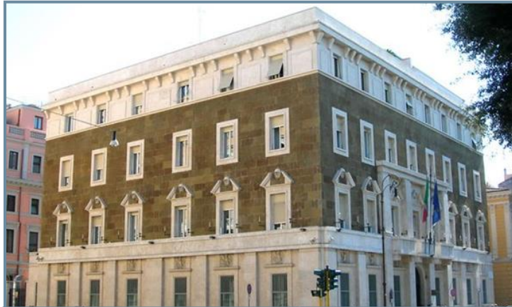
Висш съвет на магистратурата на Piazza dell'Indipendenza, Рим, Италия

съдебната независимост, всички съвети се ръководят от едни и същи общи принципи. В сферата на компетентност на някои съвети влизат решения, касаещи кариерата на съдиите, техният подбор, назначаване и оценка, както и дисциплинарни действия, докато други, като цяло по-скоро създадени съвети имат компетенции, които