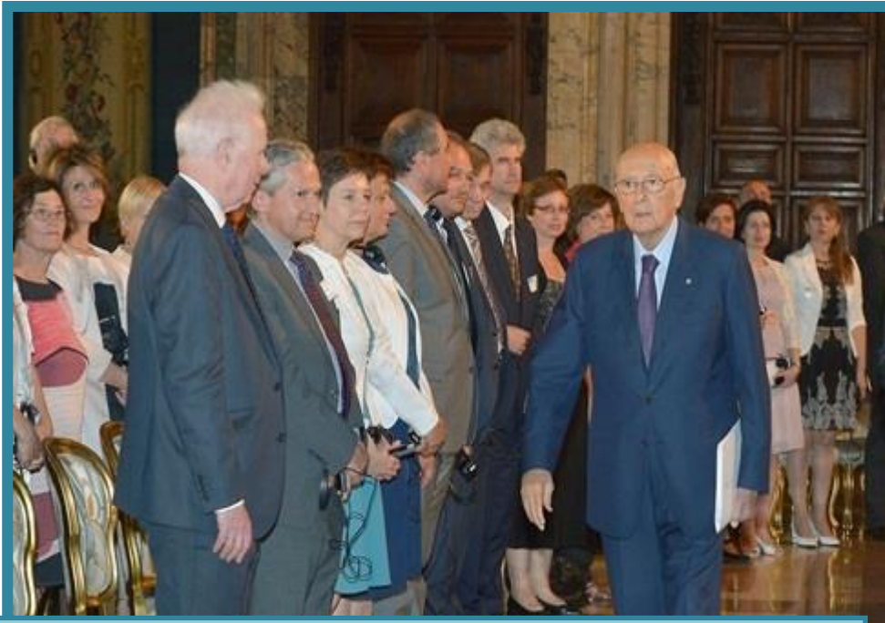
Прием на президента Наполитано при откриването на Общото събрание в Рим 2014г.