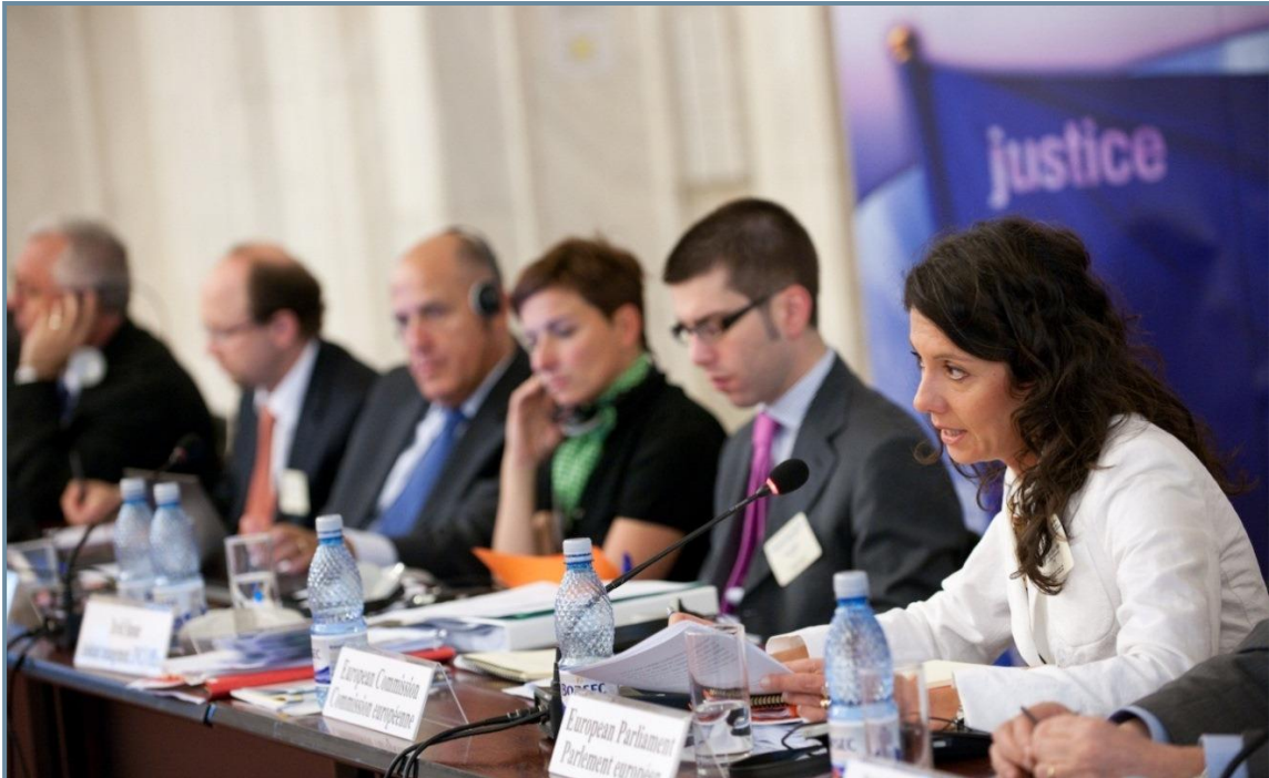
Изказване на представителя на Европейския парламент по време на Общото събрание на ЕМСС в Букурещ