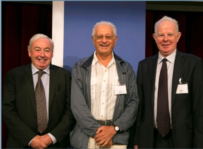
(Бивши) президенти на ЕМСС: Гилиган, Берлингер и Томас