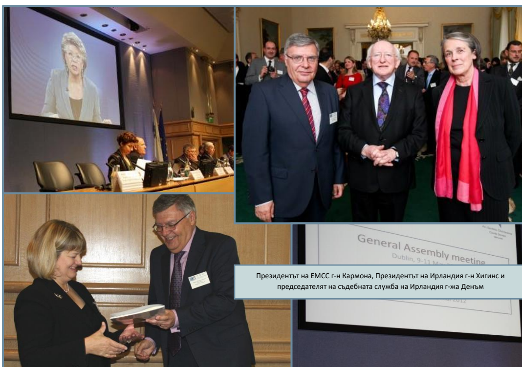
Президентът на ЕМСС г-н Кармона, Президентът на Ирландия г-н Хигинс и председателят на съдебната служба на Ирландия г-жа Денъм