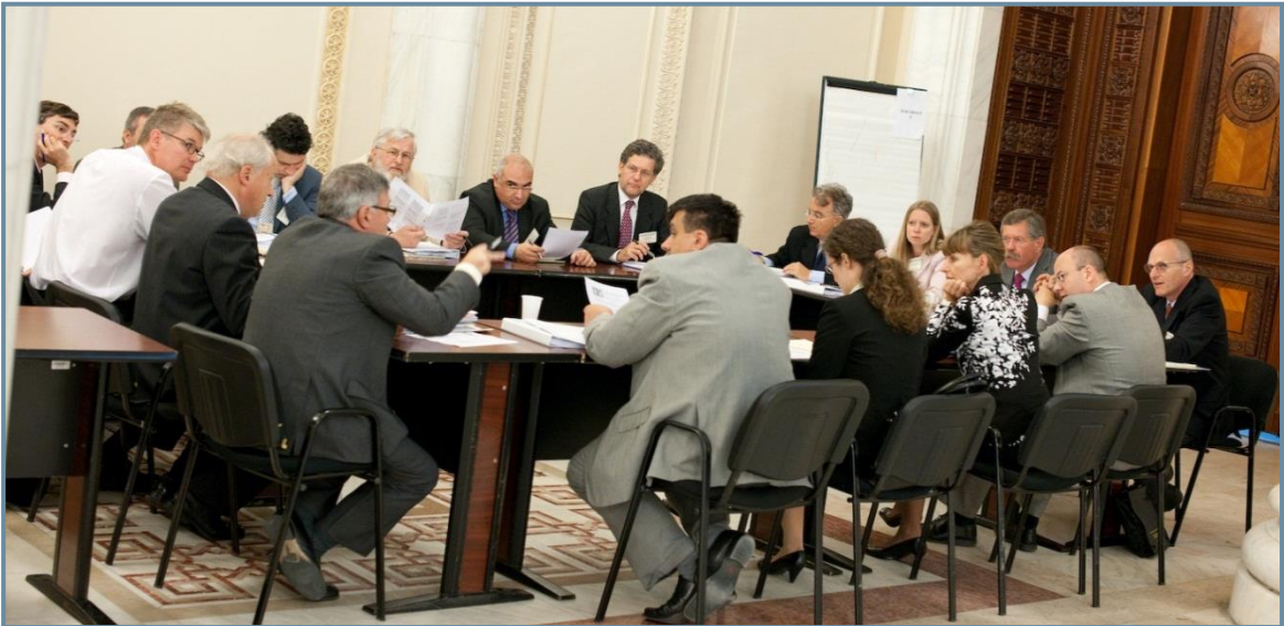
EMCC по време на дискусии